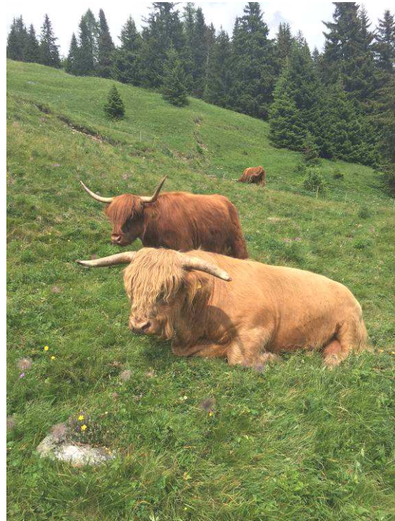
Kuh Skye bei Clemenz

Wenn 50 Tiere ihre Ferien auf der Alp, bei Berglauf, Freeclimbing, Riverrafting, Weit- und Hochsprung und andere Aktivitäten verbringen, ist die Gefahr für Unfälle immer sehr gross. Dazu kommen noch die Neugeborenen, welche das Laufen erst noch lernen müssen, was im steilen Gelände gar nicht so einfach ist. Trotz allen diesen Gefahren haben wir bis jetzt grosses Glück gehabt. Bei 6 Geburten auf der Alp gab es keine Komplikationen und die Kälbchen entwickeln sich prächtig.