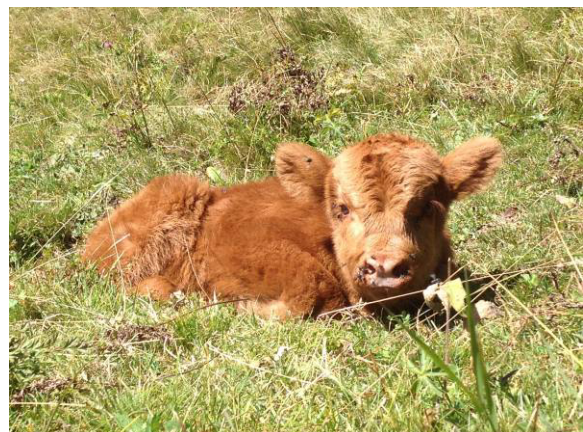
....Banrigh of Tschlin