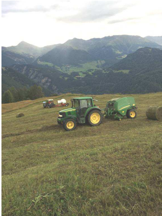
Überbetrieblicher Einsatz beim Pressen und Wickeln.